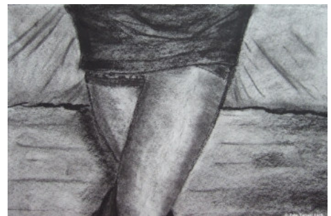
Fugitive vision