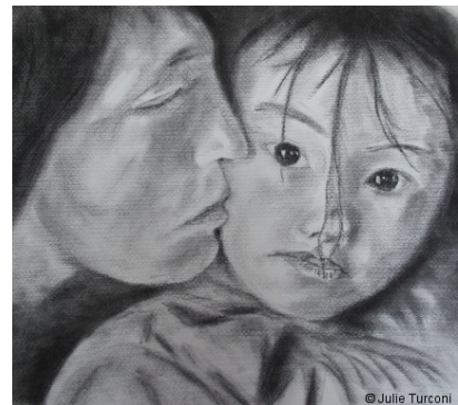
© Julie Turconi Mère et fille - © Julie Turconi 2010