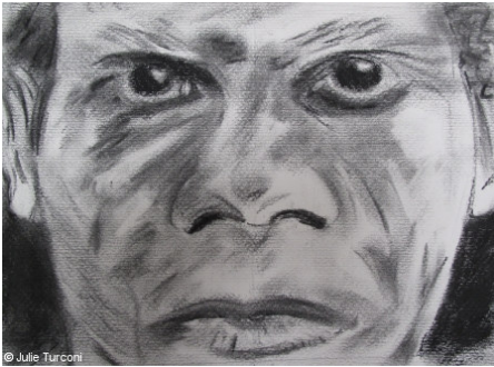
© Julie Turconi Une vieille âme - © Julie Turconi 2010