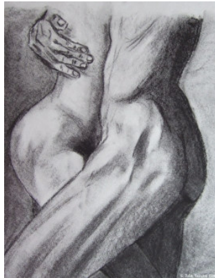
À deux