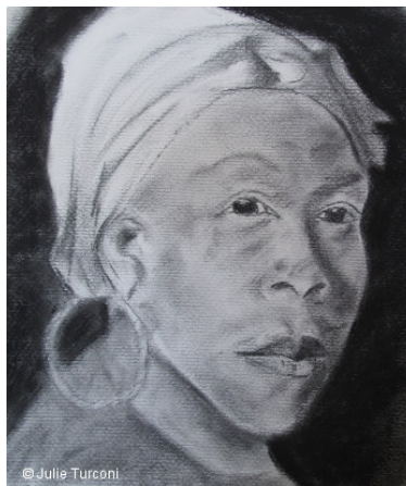
© Julie Turconi Songeuse - © Julie Turconi 2010