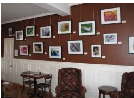
Restaurant Congé de cuisine – Montréal, mai 2010

Dans l'esprit de cette démarche, aucune des photos n'a subi de retouche numérique.